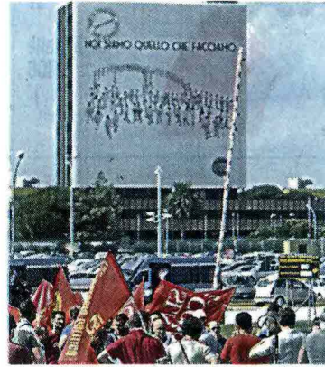
Lo stabilimento di Pomigliano