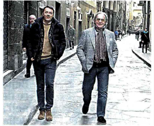
A sinistra Giorgio Napolitano sabato a conclusione delle consultazioni al Quirinale Sopra, Matteo Renzi per le vie di Firenze con Diego Della Valle