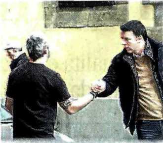
Sopra, Matteo Renzi per Firenze salutato dai fiorentini A destra, Angelino Alfano all'assemblea degli amministratori locali del Nuovo centrodestra a Roma