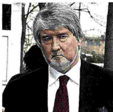
Il ministro Poletti