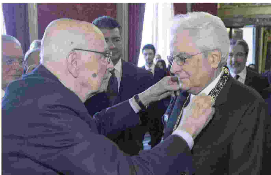
Sergio Mattarella riceve da Napolitano l'onorificenza di Cavaliere di Gran Croce

Il presidente della Repubblica, Sergio Mattarella, e il premier Matteo Renzi, dopo essere arrivati a piazza Venezia (dove hanno reso omaggio all'Altare della Patria) in un'automobile coperta passano a bordo della Lancia Flaminia decappottabile con cui raggiungeranno insieme il Quirinale