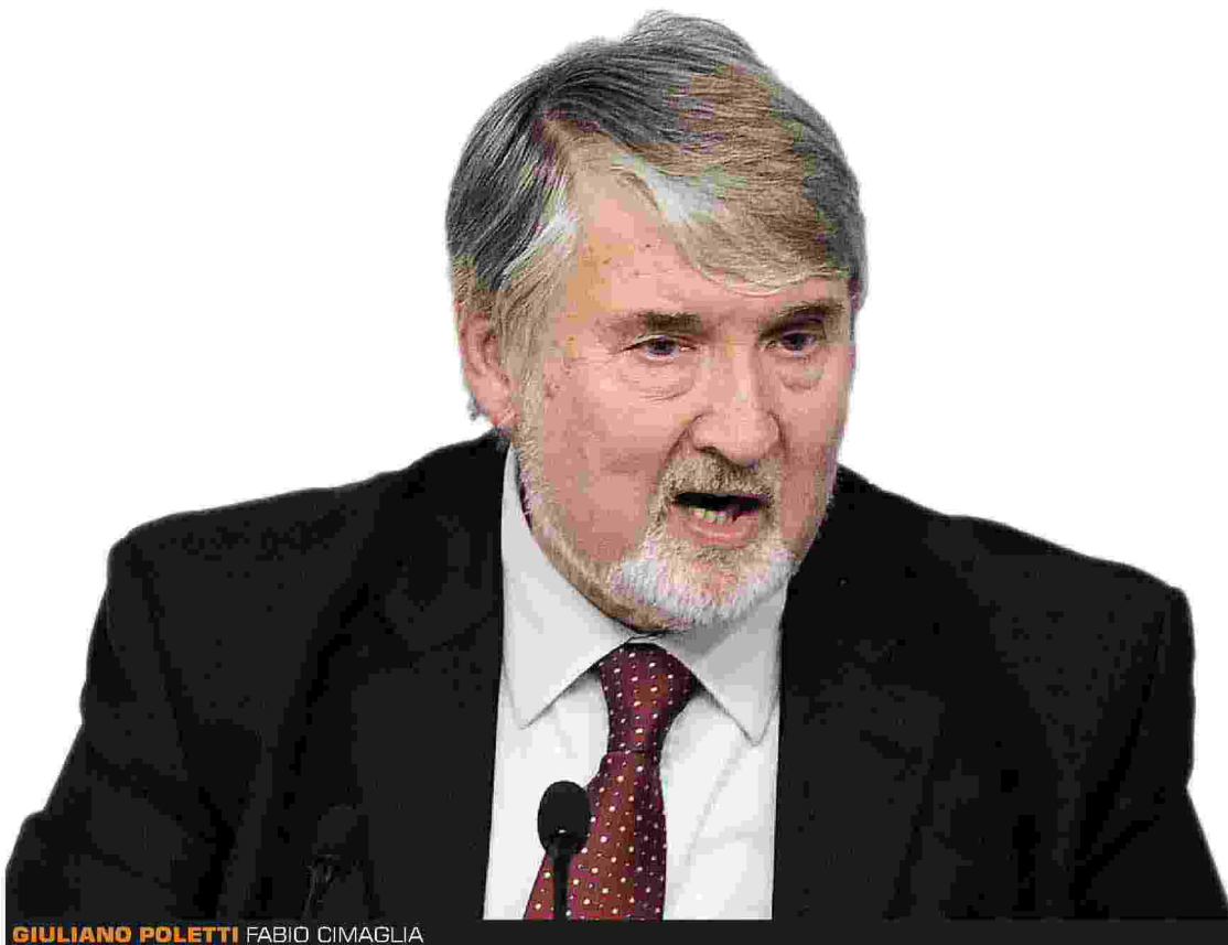
GIULIANO POLETTI FABIO CIMAGLIA

Di conseguenza il problema non riguarda il numero di ferie. «Un pezzo della riforma della scuola è appaltata a Poletti», aggiunge la Fracassi, «che intende costruire un canale formativo alternativo e separato da quello scolastico, scelto subito dopo la scuola media e realizzato in apprendistato già a partire dai quindici anni». Si va verso «percorsi con modelli formativi dequalificati, che prevedono più di un terzo dell'orario per lavoro sottoretribuito, 500 ore di attività di formazione professionale e altrettante in aziende di cui non viene verificata l'effettiva capacità formativa. Al tempo stesso viene abolita la possibilità di diplomarsi in apprendistato per i giovani che hanno abbandonato prematuramente la scuola e vengono cancellate le sperimentazioni di alternanza scuola lavoro che utilizzano lo strumento dell'apprendistato per gli studenti degli ultimi due anni della secondaria di secondo grado».