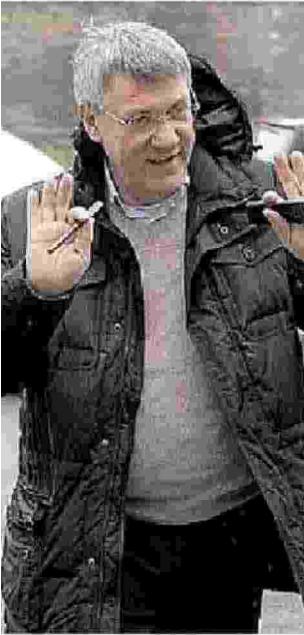
NDACALISTA Maurizio Landini, leader della