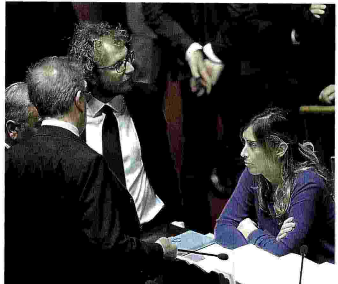
Il ministro Maria Elena Boschi e il sottosegretario Luca Lotti