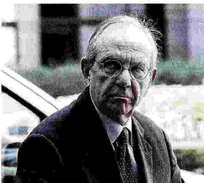
Pier Carlo Padoan

Ritaglio stampa ad uso esclusivo del destinatario, non riproducibile.