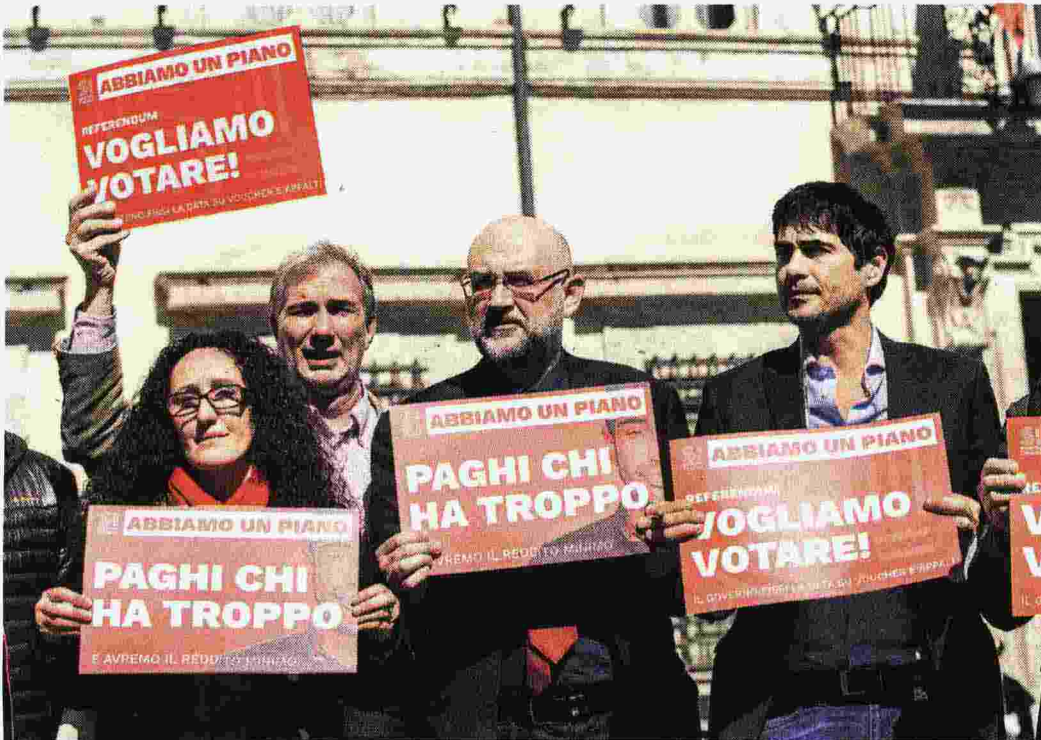
Flash mob di Si a Montecitorio. Accanto un buono lavoro