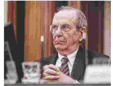
ECONOMIA Il ministro Pier Carlo Padoan

Entro il 20 ottobre in Parlamento la legge di bilancio 2018