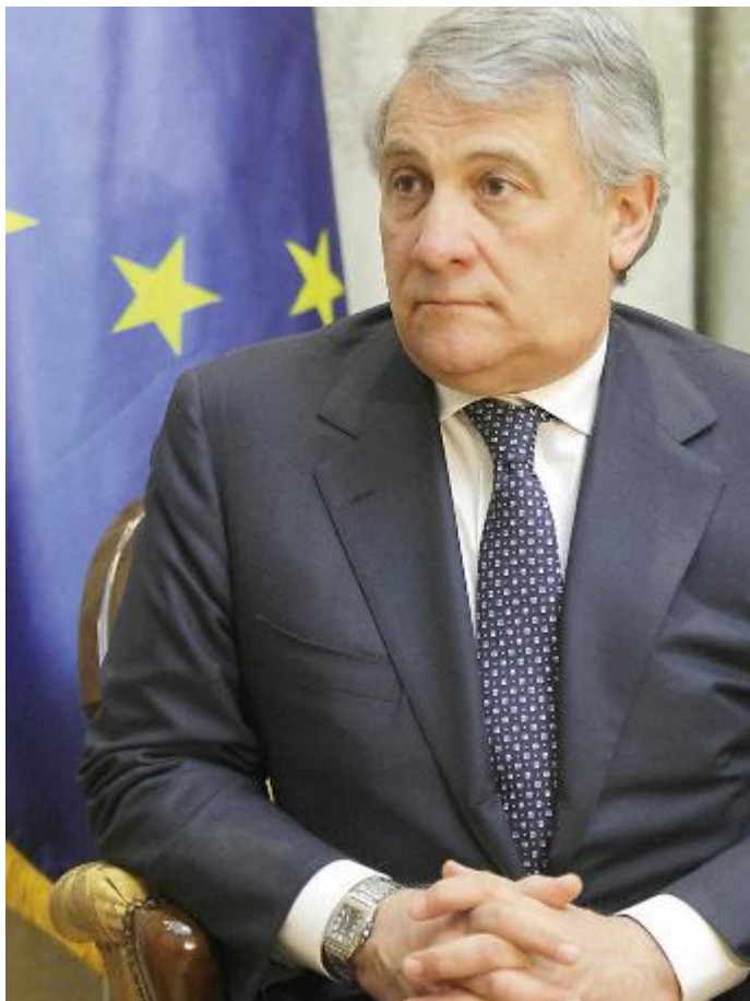
AL VERTICE Antonio Tajani presiede il Parlamento Europeo

«Sono stati commessi degli errori – ha anche detto Tajani – ma l’acciaio deve restare garanzia di crescita e occupazione nei prossimi anni. L’acciaio di Terni è di grande qualità, è strategico per l’Europa e non possiamo permettere che la sua produzione venga ridotta».