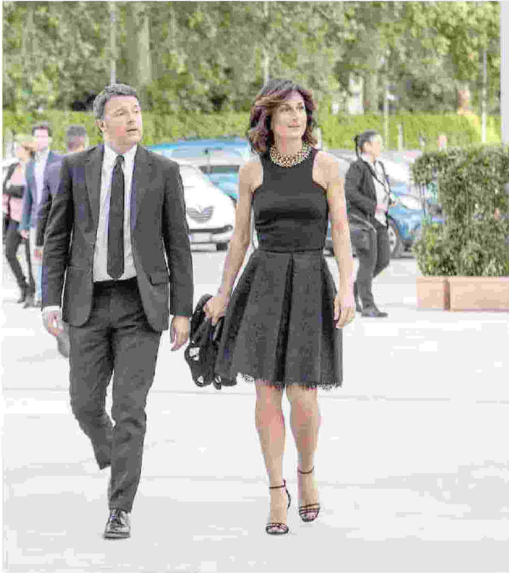
Matteo Renzi con la moglie Agnese al Maggio musicale fiorentino